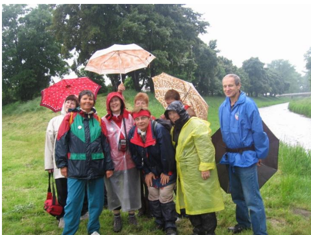
Dokážeš to taky

nemocné ženy v jejich snaze překonávat překážky a přiblížit se svými výkony ženám zdravým. Součástí akce je i šíření osvěty v podobě rozdávání letáků s informacemi o nutnosti a významu prevence této nemoci.