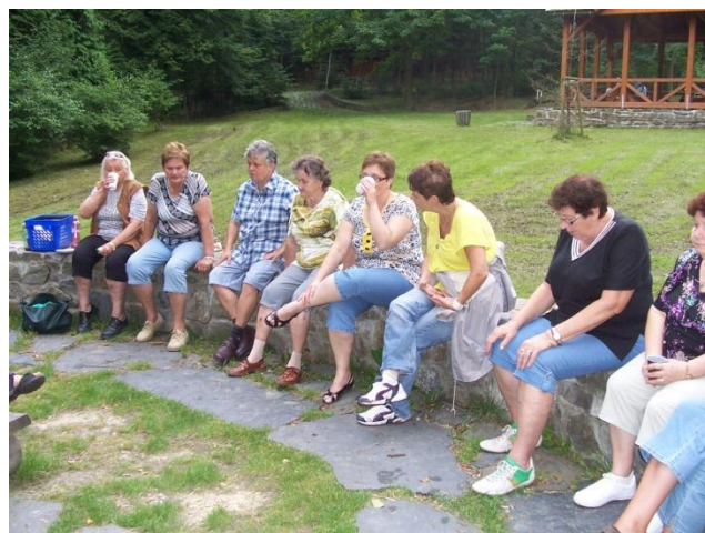
Setkání na Ježečkově paloučku

Plaveme prsa – touto akcí jsme podpořili aktivitu evropské koalice EUROPA DONNA spolu s Aliancí žen s rakovinou prsu, o.p.s, Praha. Plaveckou štafetu, věnovanou Dni zdravých prsů jsme organizovali za podpory Města Krnov a krnovského plaveckého oddílu. Celkem se jí zúčastnilo 92 osob, za sdružení Onko Niké plavalo 19 členek. V předsálí krnovského bazénu jsme měli stánek s osvětovými materiály o problematice samovyšetřování prsu, který byl přijat s velkým zájmem. Tato celorepubliková akce probíhala v sobotu 15. října i v dalších 13 městech a účastnilo se jí 17 organizací žen s nádorovým onemocněním prsu.